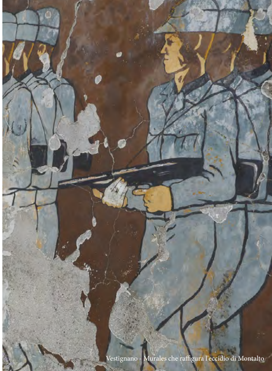
Vestignano - Murales che raffigura l'eccidio di Montalto

ore 13.00 chiusura della scuola e buffet di saluto